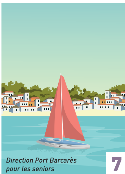
Direction Port Barcarès pour les seniors