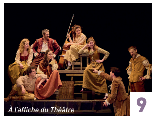
À l'affiche du Théâtre