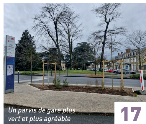
Un parvis de gare plus vert et plus agréable