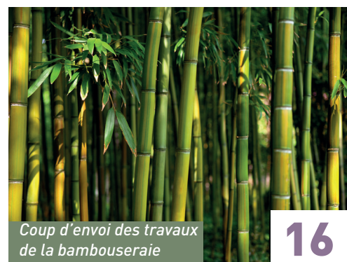
Coup d'envoi des travaux de la bambouseraie