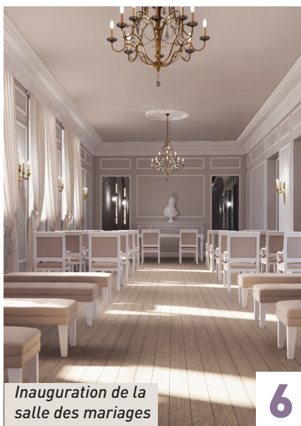
Inauguration de la salle des mariages