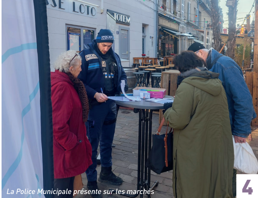
La Police Municipale présente sur les marchés