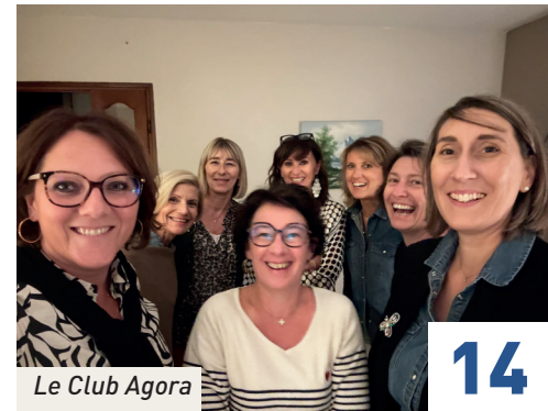
Le Club Agora