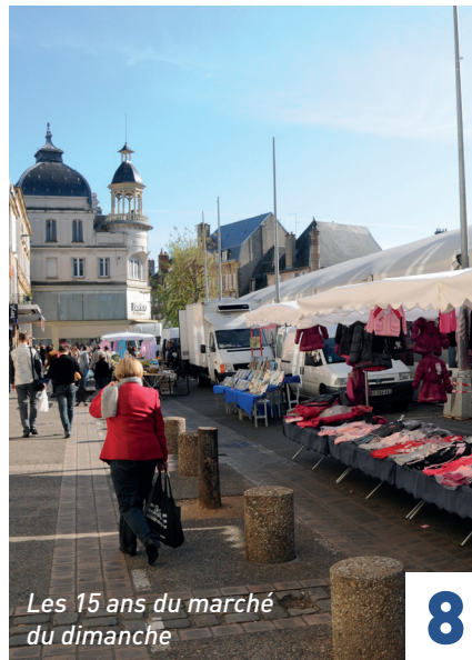
Les 15 ans du marché du dimanche