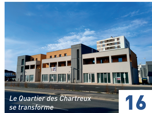
Le Quartier des Chartreux se transforme