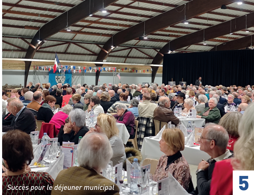
Succès pour le déjeuner municipal