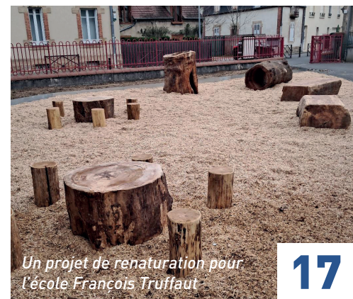
Un projet de renaturation pour l'école François Truffaut